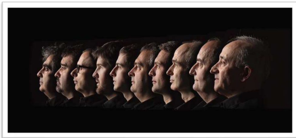
BANDA TXISTULARIS DONOSTIA